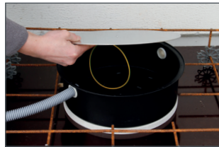
Rohre/Kabel einführen und stabile Blechplatte mit Kabelbinder befestigen.