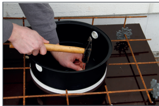
Bei Ortbeton auf Schalung nageln, im Fertigteilwerk auf Schaltisch kleben.